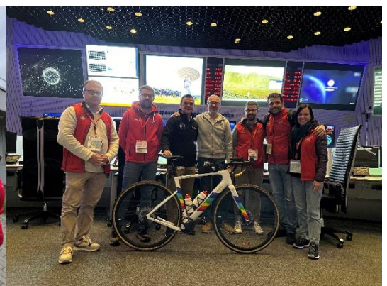
G-Team Un Aiuto per Aiutare i Bambini ONLUS - Via Roma Imperiale n.9 -28893 Chesio di Loreglia (VB) - Italia